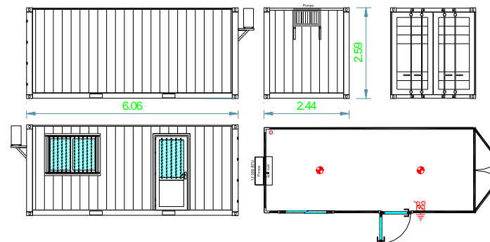
Container Maritime 20' Aménagé "Standard"